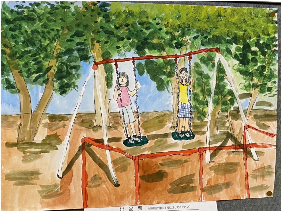
出品票 (必ず絵の中央下部にはってください)