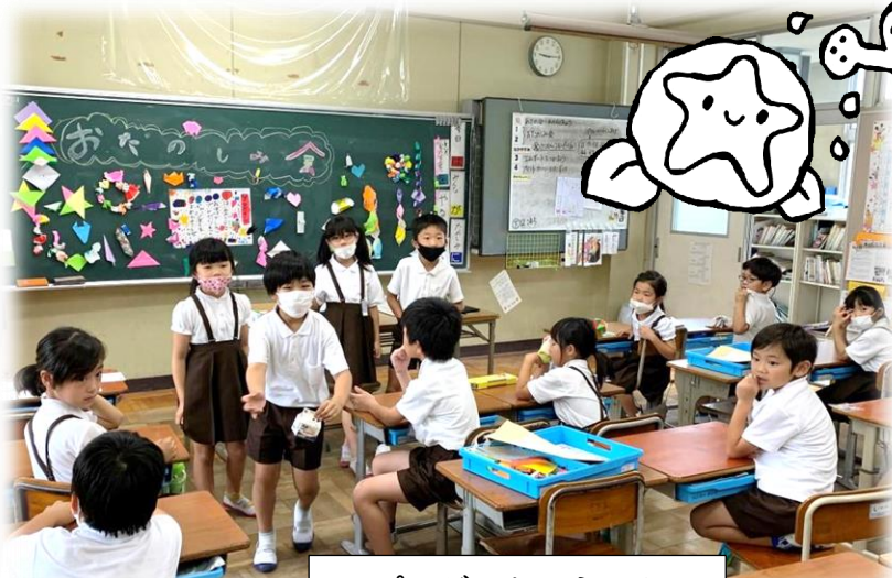
プレゼントこうかん