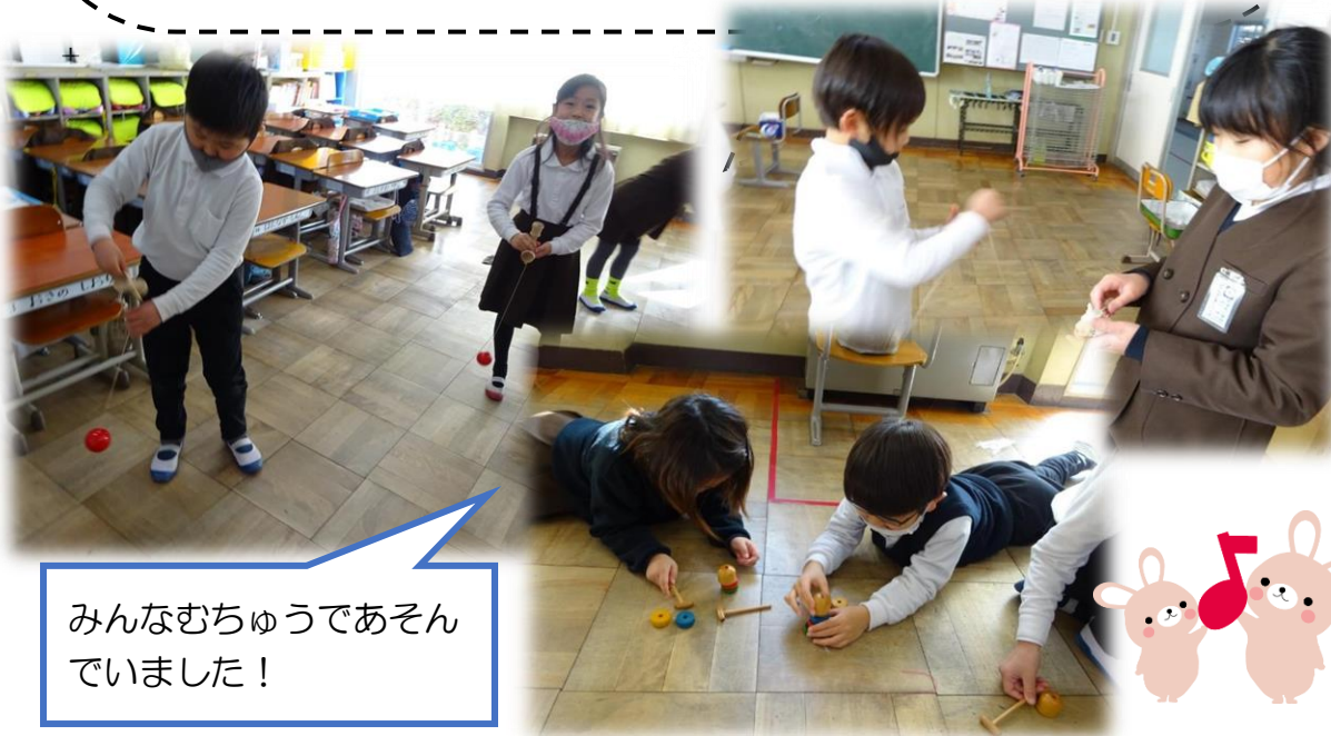
みんなむちゅうであそんでいました！

せいかつのじかに「あそび」についておはなしをしました。「みんなって、いつもどんなあそびをしているの？」とたずねると、ゲーム、YouTube、シルバニア、おにごっこ、けいどろ、ドッチ、トランプなどなど、たくさんのお遊びをおしえてくれました。「むかしからつたわるあそびもしてるかなあ。」とつづけてたずねると、「こまとか？」「けんだま！」と、いままでにやったことがあるあそびをおしえてくれました。小学校にもこまやけんだまがあるのでやってみよう！ということで、きょうは、こま・けんだま・だるまおとしにちょうせんしました。はじめてやった！という人もいたのですが、こまやけんだまにどっぴりはまった人もたくさんいて、「せんせい、けんだまってどこでかったん？」「こまかってほしいー！」というこえもきこえてきました。タブレットやスイッチなどであそぶのもたのしいけれど、たまにはちょっとちがったおもちゃであそんでみるのもいいかもしれませんね♪