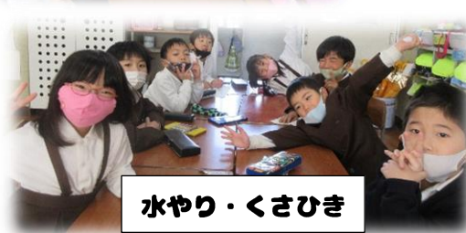
水やり・くさひき