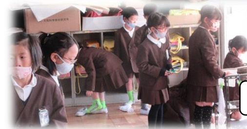
おにごっこ&キャッチボール