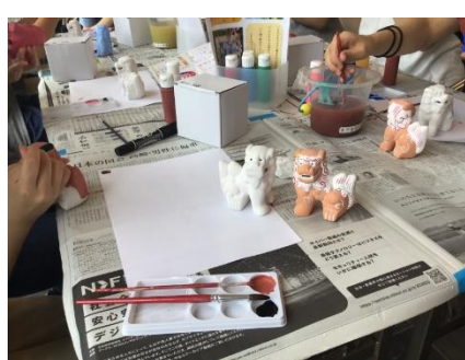
マリリン体験 シーサーの絵付け