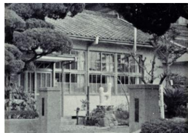
昭和26年ごろの校門

戦争など様々な歴史をくぐりぬけ、今も感染症の流行という未曾有の出来事の最中ではありますが、「みんなが明日も学校へ来たいと思える学校に」なるよう、確かな教育の歩みを続けていきたいです。