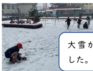
大雪が降りました。(1/12)