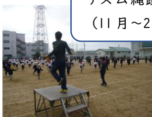
リズム縄跳び (11月~2月)