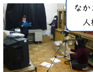
なかま集会(1/12) 人権作文発表