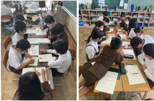
◆算数 1立方センチメートルで・・・