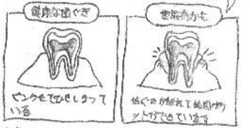
最後には、歯を支える骨まで溶けてしまいます。