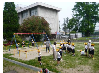
しっかり手を洗ってから、 遊具で遊んでいます。