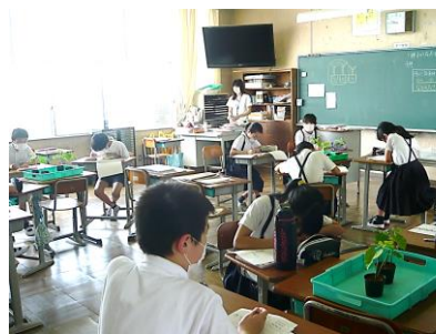
休業中に動画で観た ハウセンカを観察しました。