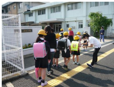
校舎に入る前に 健康観察を行っています。

そしていよいよ6月15日からは、給食もある通常授業を再開することになります。もちろん、感染症予防対策は継続して行うとともに、文部科学省が示した「近距離での歌唱や管楽器演奏」「調理実習」「密集・接触する運動」などの教育活動は当面控えるなど、感染リスクを高めないように教職員一人一人が気持ちを緩めることなく取り組んでいかなければなりません。学校再開に当たっては、学習の遅れや運動不足、これまで活動が制限されたことによるストレスなど、子どもたちに課せられた問題は大きいです。そうした課題にしっかりと向き合い、取組を進めていくためには、保護者や地域との連携は欠かせません。皆様のご理解とご協力をよろしくお願いいたします。